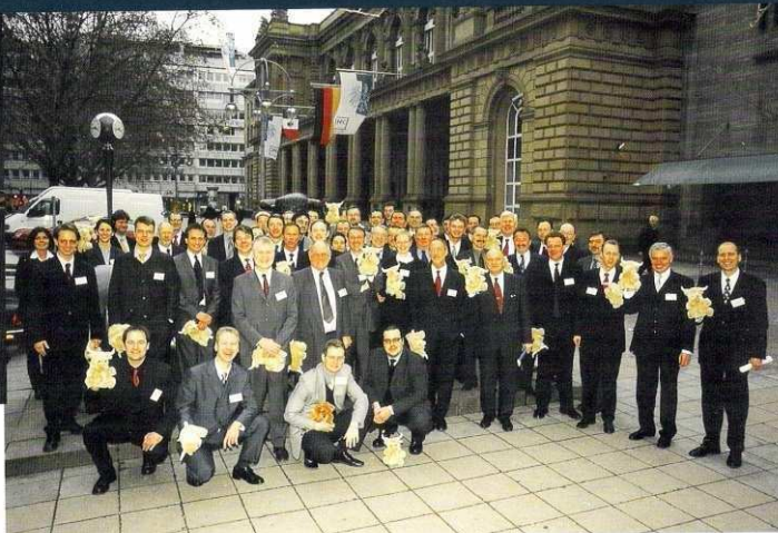
FRANKFURTER RUNDSCHAU 27.1.2001